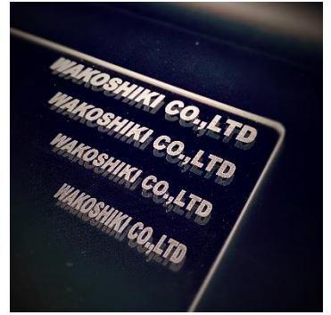
●社名などお好みのデザイン