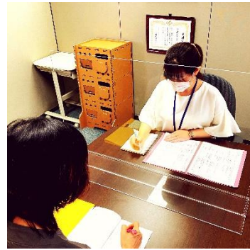
●安定感のある窓無しタイプ