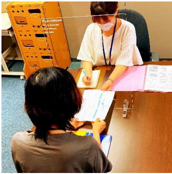
●書類やお金などの受け渡し窓を付ける

置く場所に合わせて1mm単位でのフルオーダーでお好みのパーテーションに仕上げます